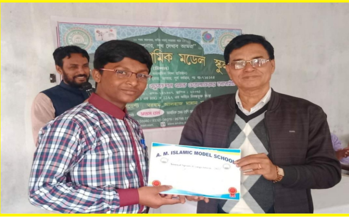
স্কুলের বার্ষিক ক্রীড়া প্রতিযোগিতায় স্থানাধিকারীদের কে সনদপত্র প্রদান ।