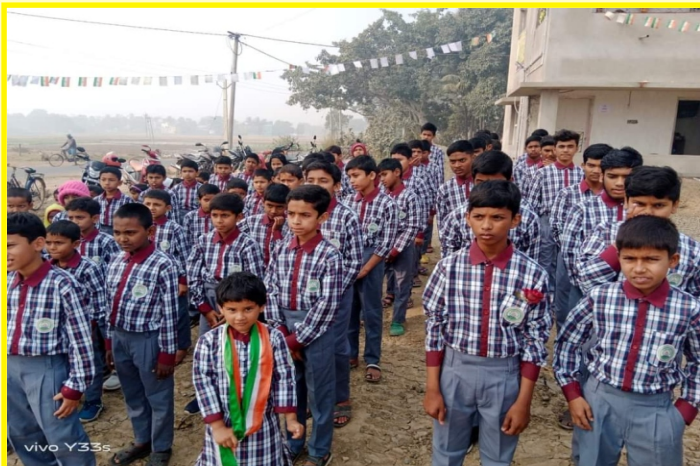
স্বাধীনতা দিবস উৎযাপনের সময় স্কুলের ছাত্র-ছাত্রীরা