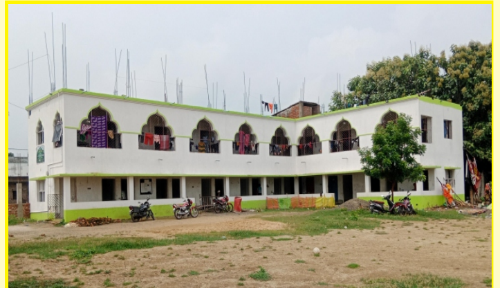
আলহামদুলিল্লাহ, স্কুলের নিজস্ব বিল্ডিং